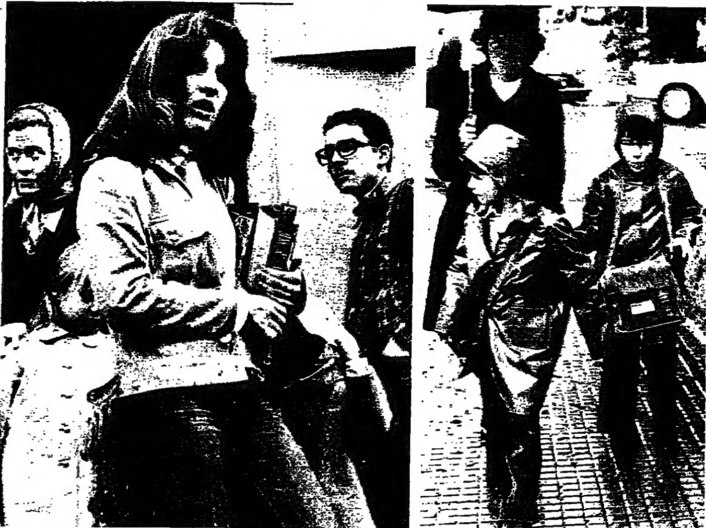
في الطريق الى المدرسة تحت المطر ■ العودة الى المدرسة بعد الاضراب الطويل ■ (تصوير محمد شهبو)

استؤنفت الدراسة أمس في معظم المدارس الخاصة ، ودخل المعلمون الى الصفوف ، بعد اضراب استمر ٢٠ يوماً ، وجاء امتداداً لعطلة اعياد الاضحى والعيد وراس السنة . وجاءت خبطة المعلمين ، بعد اقترابهم الى جانب توصية مجلس نقابة معلمي المدارس الخاصة بتعليق الاضراب لاقباله السادس من آذار ( عيد المعلم ) رئيساً مستكمل وزارة التربية دراسة التظاوت التي « اسقطها » قرار مجلس الوزراء بشأن مطالبهم .